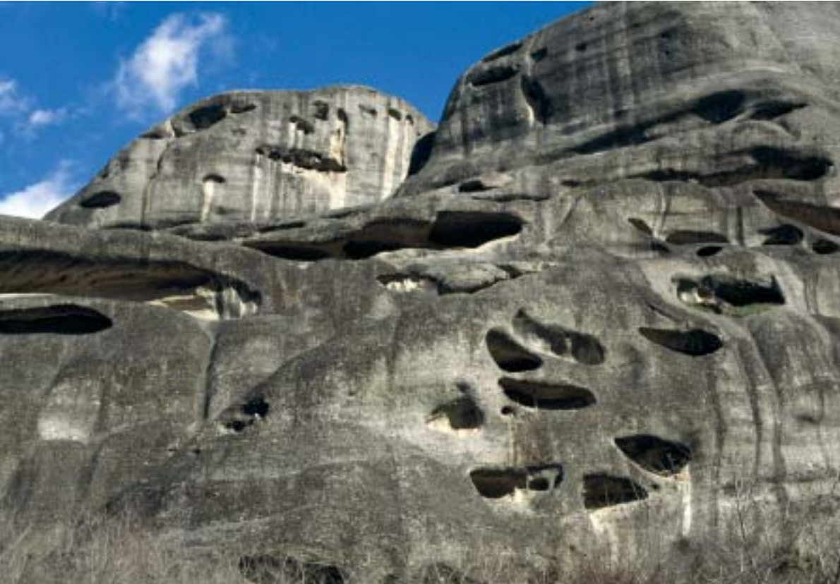
До някои манастири в Метеора достъпът е възможен само чрез алпинистки техники Some monasteries in Meteora are accessible only with special mountaineering equipment

Метеора е обширна равнина в северната част на Тесалия, върху която са разпръснати десетки гигантски каменни колони, извисяващи се в небето на 628 м над морското равнище. Отвесните им стени са проядени от естествени пещери, а на върховете им са накацали християнски манастири. Пейзажът е напълно сюрреален - като че Господ е свалил с няколкостотин метра надолу целия свят, като е оставил само храмовете. Това усещане е още по-силно на върха на скалите, откъдето