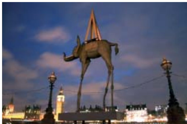
Салвадор Дали според някои критици е получил пряко вдъхновение от Метеора за “Изкушението на св. Антоний” и “Космическия слон”

Най-големият е “Мони Мегалу Метеору”. Достъпът към него е пазен от безпомощни на пръв поглед възрастни гъркини, облечени в черно. Те стоят смирено като богомолки, пристъпвайки от крак на крак пред портите му. Обаче в мига, в който ни съзират в далечината, богомолките освирепяват и започват пронизително да крещат на пет-шест езика, размахвайки със страшна сила туристическите брошурки, които продават. Преминали с мъка през обсадата, изкачваме триста метра по каменни стъпала. Гледката на върха обаче ни кара да забравим всички клетви, изречени по пътя. ▶