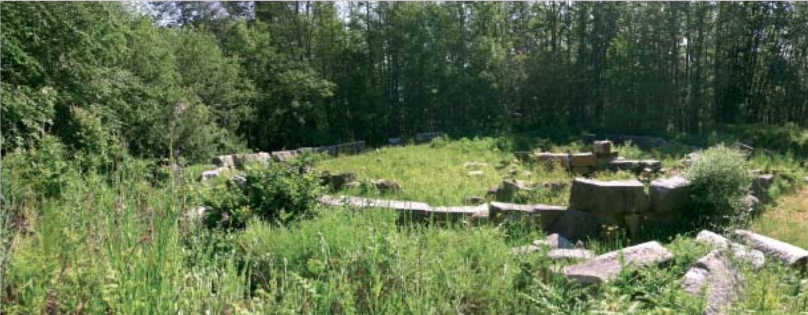
Мишкова нива е едно от местата, където fotografia не е в състояние да предаде точно усещането за размер Mishkova Niva is one of the places where photography is unable to render the sense of dimension

По-нататък е храмът на Аполон и той наистина успява да ни закове на място. В средата на нищото, на една дива зелена поляна, се издига масивна постройка от камък, полуразрушена. Или по-точно - полуизградена. Част от номерираните от археолозите каменни блокове все още не са наредени по предполагаемите им места. Ако това беше на 400 метра по-надолу, мислим си, правителството отдавна да го беше обявило за национално богатство, наоколо щеше да има музей с билет, струващ най-малко 10 евро, а слезлите от симетрично паркирали автобуси туристи вече щяха да пият бира в специално изградена закусвалня. Но това е България. Не, това е Странджа... Тя обича да пази тайните си.