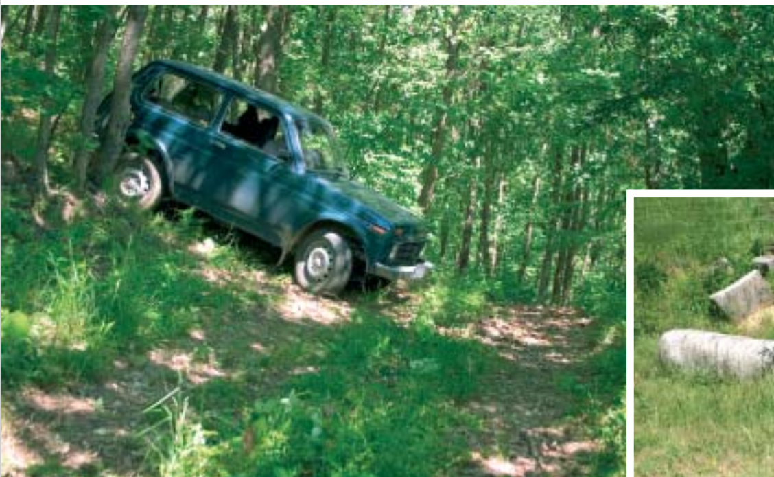
Пътищата към връх Голямо градище са почти непроходими The roads to Golyamo Gradishte are almost inaccessible

самото начало да посреща сдържано интереса ни към Мястото, водачът ни стоически понася нашето любопитство. А ние просто нямаме търпение да видим скалата, около която се разиграва една от най-мистериозните драми по времето на социализма. ►