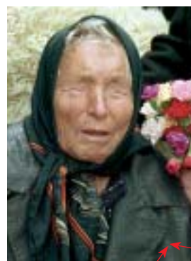
В основата на мистерията стои пророчицата Ванга (1911-1996 г.)

Clairvoyant Vanga (1911-1996) was at the basis of the mystery