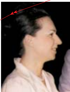
Людмила Живкова, тогава министър на културата и всемогъща дъщеря на всемогъщ диктатор Ludmilla Zhivkova, then minister of culture and omnipotent daughter of an omnipotent dictator