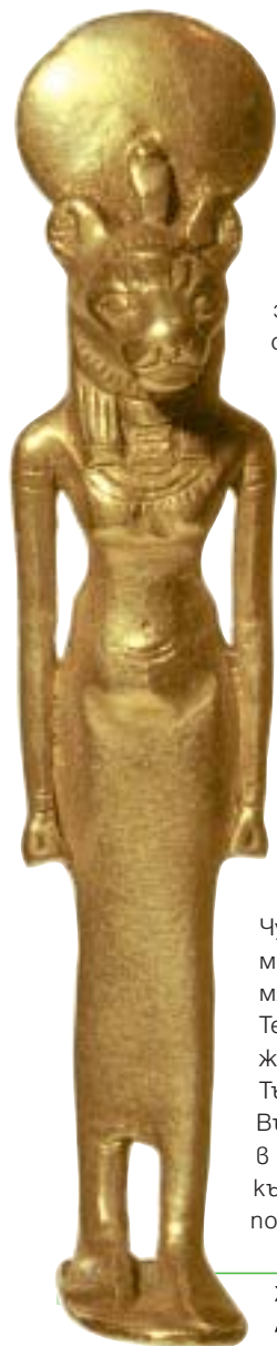
Жена с глава на котка: египетската богиня Бастет A woman with the head of a cat: Egyptian goddess Bastet

вслушва повече в гласовете на спиритисти, отколкото в логиката на действителността.