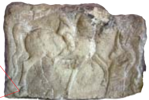
Да изобразяват човек на кон е било обичайно за траките, нахотка в Мишкова нива The Thracian liked to depict men on horses, a find at Mishkova Niva

That evening, the moon's rays replicated the motion of the sun. "We were so overwhelmed, we continued standing before the boulder in the pitch darkness, nobody daring to break the silence; and then happened something I shall remember for as long as I live, for it transcends even the greatest of miracles..." ►