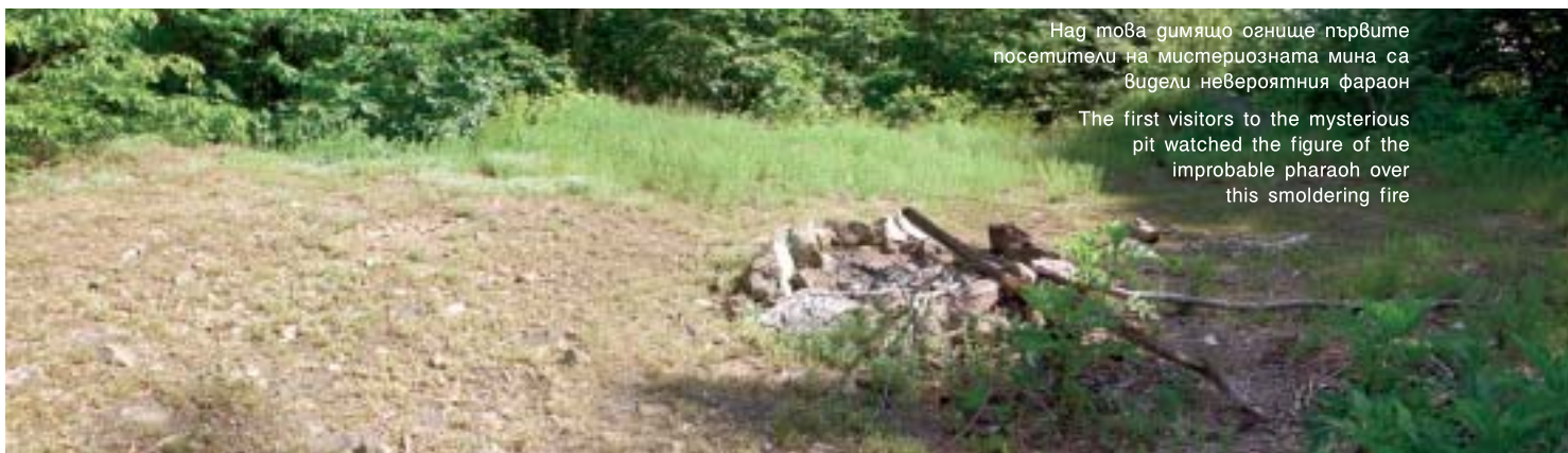
Наг това гимназио огнище първите посетители на мистериозната мина са видели невероятния фараон